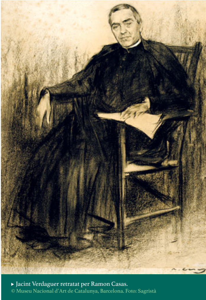
► Jacint Verdaguer retratat per Ramon Casas. © Museu Nacional d'Art de Catalunya, Barcelona. Foto: Sagristà

Des de l'època del patriarca Joan Güell, la família tenia en propietat una llotja al Gran Teatre del Liceu, aleshores acabat de construir: la llotja 20 del primer pis, amb la seva avantllotja. Joan Güell va assistir a la funció inaugural del teatre el 4 d'abril de 1847, en la qual es va oferir un programa variat amb música instrumental, teatre parlat, ball i una cantata. 7 A més era membre de l'exclusiu Cercle del Liceu. 8