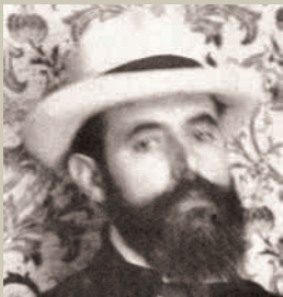
Gaspar Homar i Mesquida Autoretrat (col·lecció particular)