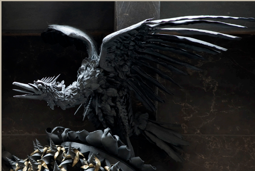
Au fènix que trobem a l'entrada del Palau. Ramon Manent/Diputació de Barcelona.